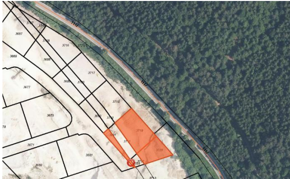
Lega parcel ID znak: parcela 1677 3691, parcela 1677 3719, parcela 1677 3720 in parcela 1677 3701

Ocenjena vrednost je določena na podlagi izdelane ceditve.