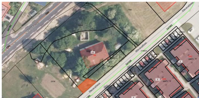
Lega parcele ID znak: parcela 1676 257/7

Na podlagi navedenega predlagamo sklenitev neposredne pogodbe namesto razlastitve.