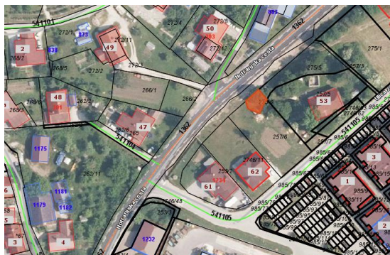
Lega parcele ID znak: parcela 1676 275/6

Ob upoštevanju, da nepremičnina, ki je predmet razpolaganja, smiselno dopolnjuje zemljišče stranke in da je Občina za svoje potrebe ne potrebuje, na zemljišču ID znak: parcela 1676 257/7 pa so predvidena parkirišča menimo, da je tak dogovor smiseln in utemeljen. Predlagamo, da se sklene neposredna prodajna pogodba.