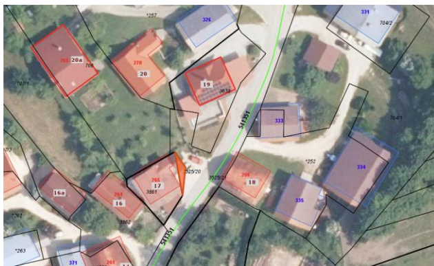
Lega parcele ID znak: parcela 1677 3525/20

Lastniki bližnje stanovanjske hiše so v geodetskem postopku ugotovili, da del njihove stavbe leži na zemljišču, ki ni v njihovi lasti in je v zemljiški knjigi vknjiženo kot javno dobro. Na svoje stroške in v dogovoru z Občino so izvedli parcelacijo, s katero je nastala predmetna nepremičnina, ki je predmet razpolaganja. Hkrati je bil izražen tudi interes po odkupu navedene nepremičnine. Glede na vse navedeno menimo, da je razpolaganje utemeljeno, Občina navedene nepremičnine za svoje namene ne potrebuje, zato predlagamo, da se vlogi ugodi in se sklene neposredna prodajna pogodba.