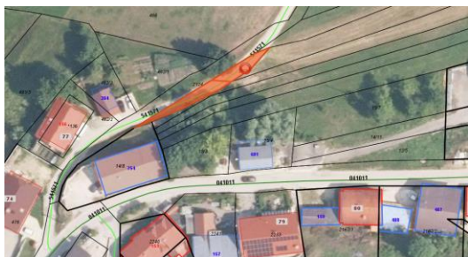
Lega parcel/ ID znak: parcela 1660 24/1 in parcela 1660 25/1

Navedeni nepremičnini se v Načrtu pridobivanja nepremičnega premoženja za leto 2026 uvrstijo pod zap. št. 24. Občinskemu svetu predlagamo, da predlagano dopolnitev Načrta pridobivanja nepremičnega premoženja za leto 2026 obravnava in sprejme.