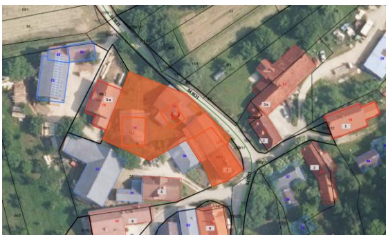
Lega nepremičnin ID znak: parcela 1632 3402 , ID znak: parcela 1632 *12, ID znak: parcela 1632 *13 , ID znak: parcela 1632 57

Glede na vse navedeno predlagamo, da Občina svoj solastniški delež proda in se sklene neposredna prodajna pogodba.