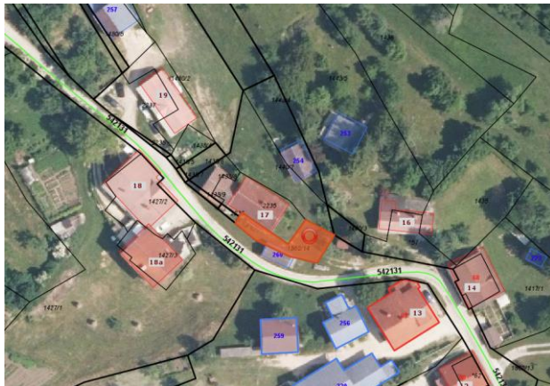
Lega parcele ID znak: parcela 1658 1862/14

Lastnica bližnje stanovanjske hiše je izkazala interes za nakup navedenega zemljišča. Na svoje stroške in v dogovoru z Občino je že izvedla parcelacijo s katero je nastala predmetna nepremičnina, ki je predmet razpolaganja. Nepremičnina je nastala s parcelacijo zemljišča, ki je v zemljiški knjigi vknjiženo kot javno dobro, zato je tudi na predmetni nepremičnini v ZK tak vpis. Glede na navedeno menimo, da je razpolaganje utemeljeno, občina za svoje namene tega ne potrebuje, zato predlagamo, da se vlogi ugodi in se sklene neposredna prodajna pogodba.