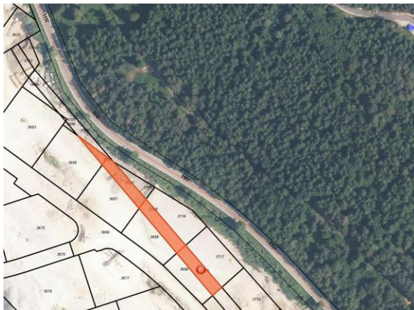
Lega parcel ID znak: parcela 1677 3706, ID znak: parcela 1677 3707, ID znak: parcela 1677 3708, ID znak: parcela 1677 3709

Ocenjena vrednost je določena na podlagi izdelane cenitve.