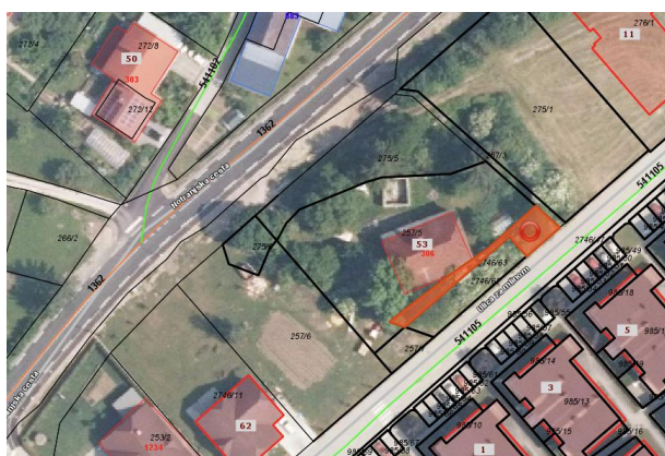
Lega parcele ID znak: parcela 1676 2746/63

Lastnica sosednjega zemljišča je izrazila interes po odkupu navedene nepremičnine, predhodno so že bili izvedeni potrebni geodetski postopki. Menimo, da predmetna nepremičnina smiselno dopolnjuje zemljišče stranke in je funkcionalno del tega zemljišča, Občina pa ga za svoje namene ne potrebuje, zato predlagamo, da se vlogi ugotovi in se sklene neposredna prodajna pogodba.