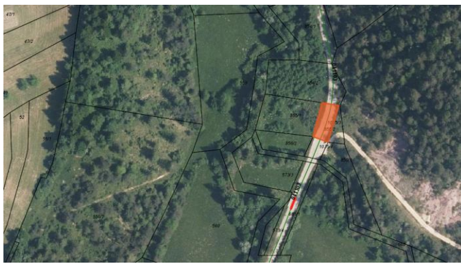
Lega parcele ID znak: parcela 1664 1035/3

Na podlagi navedenega predlagamo sklenitev neposredne pogodbe namesto razlastitve.