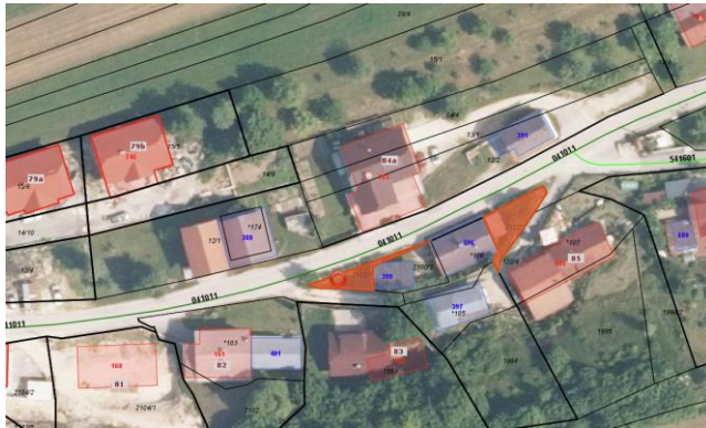
Lega parcele ID znak: parcela 1660 2122/1, parcela 1660 2122/2 in parcela 1660 2122/4

Lastnica zemljišč katastrska občina 1660 UNEC parcela 24/1 in katastrska občina 1660 UNEC parcela 25/1 je izrazila interes po prodaji navedenih nepremičnin, ki ležita na območju kategorizirane ceste JP, šifra odseka: 541571 (Unec 77a) in hkrati po nakupu predmetnih nepremičnin 2122/1, 2122/2 in 2122/4, vse k.o. Unec, ki predstavljajo funkcionalno zemljišče nepremičnin v njeni lasti. Tak predlog je bil v preteklosti že usklajen z Občino Cerknico in tudi že dosežen dogovor, vendar pa do končne realizacije ni prišlo. Ob upoštevanju vsega navedenega in dejstva, da Občina navedenih nepremičnin za svoje namene ne potrebuje, menimo, da je tak dogovor smiselni in utemeljen.